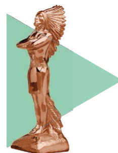
Prêmio Bronze Notas finais entre 6,00 e 6,99

Poderão existir Categorias não premiadas ou que não tenham 1º e/ou 2º e/ou 3º lugar.